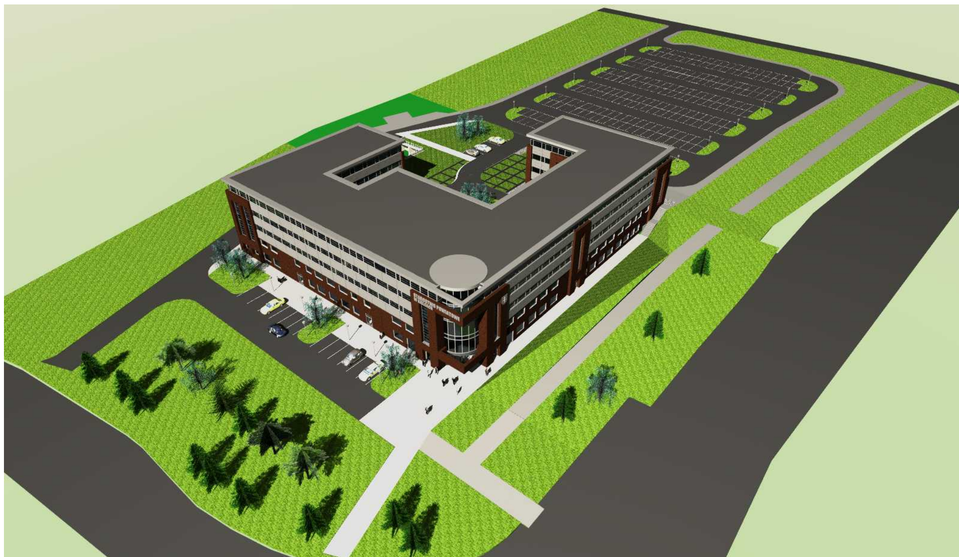
09. Widok z lotu ptaka