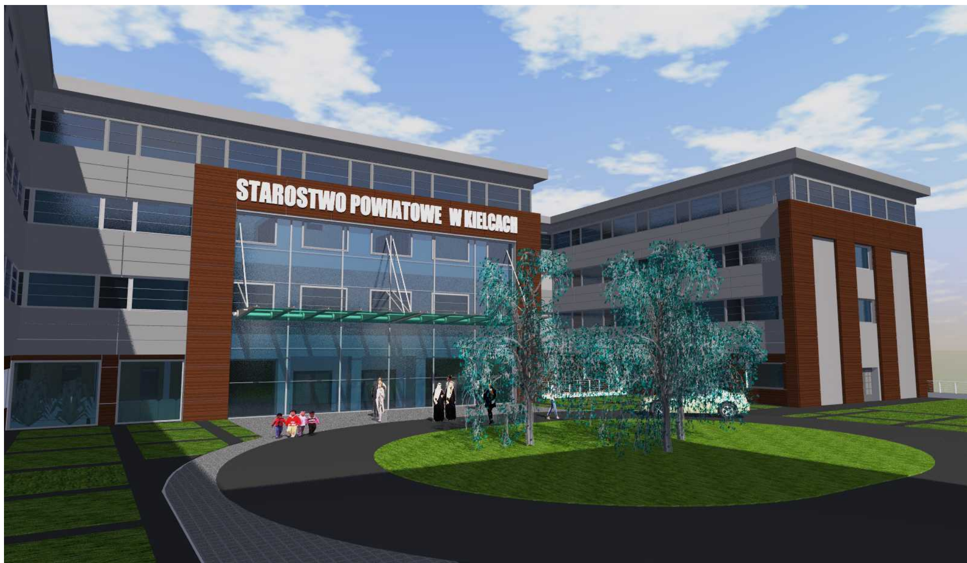
04. Widok od strony zachodniej - dziedziniec