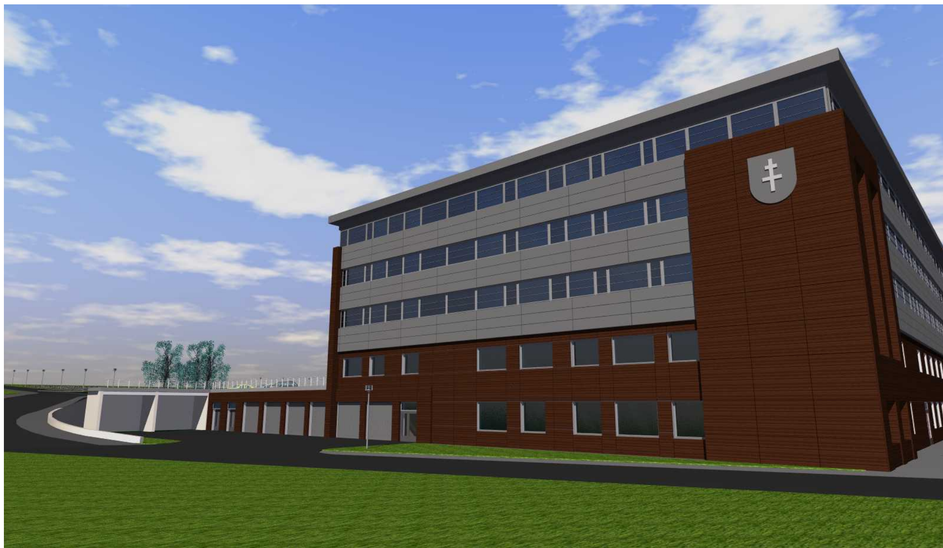
01. Widok od strony wschodniej