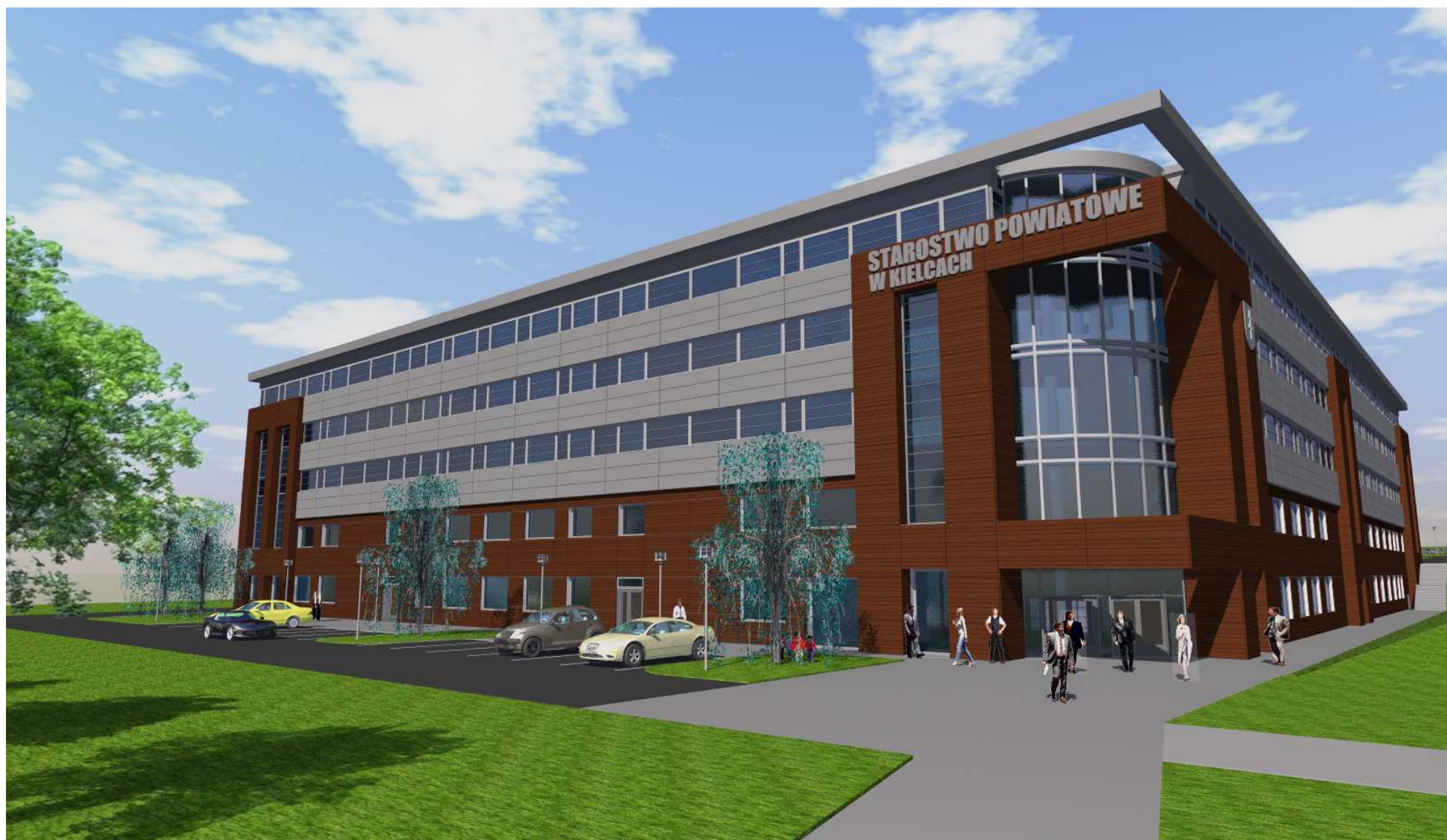
08. Widok od strony północnej