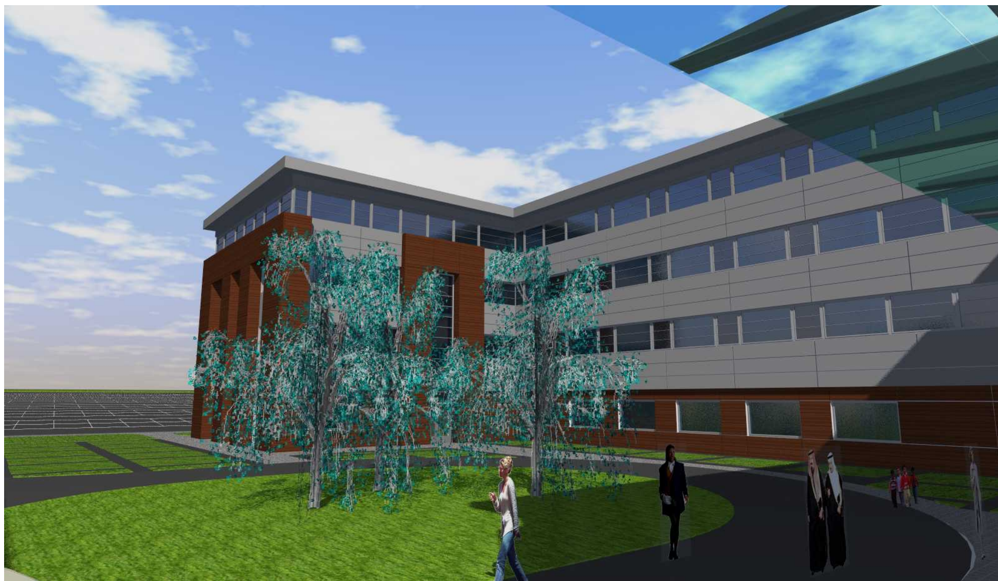
05. Widok od strony północna - dziedziniec