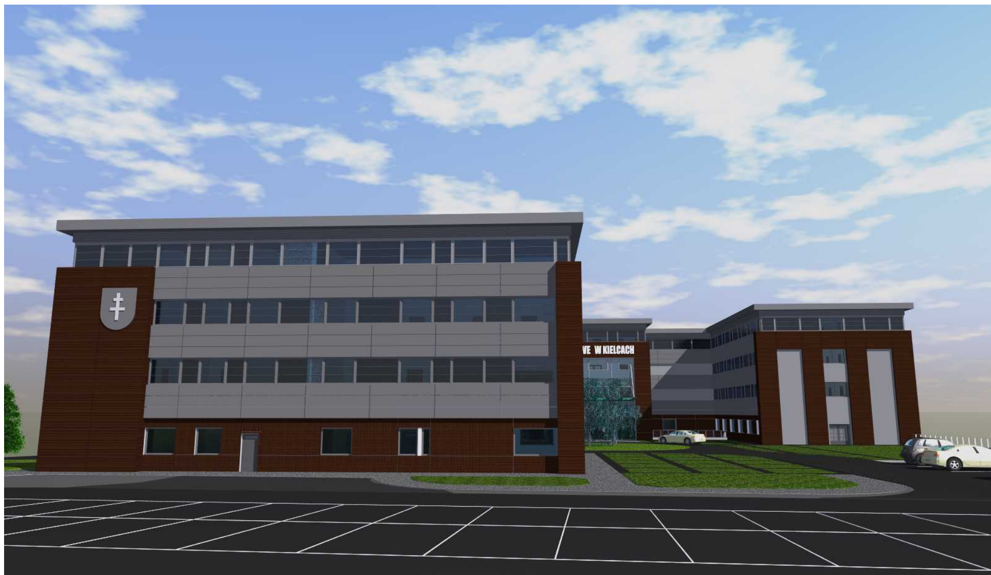
06. Widok od strony południowej