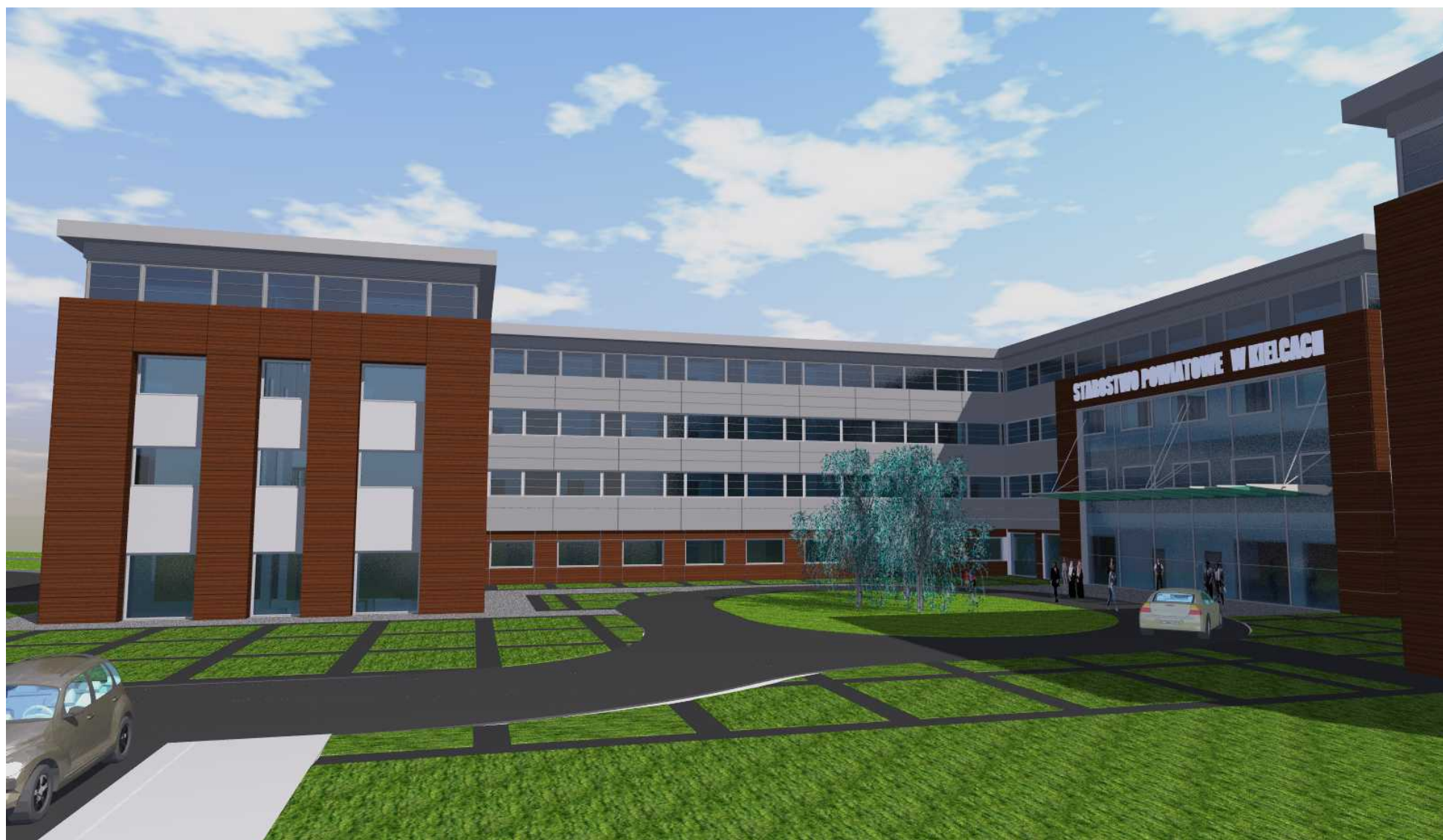
02. Widok od strony wschodniej - dziedziniec