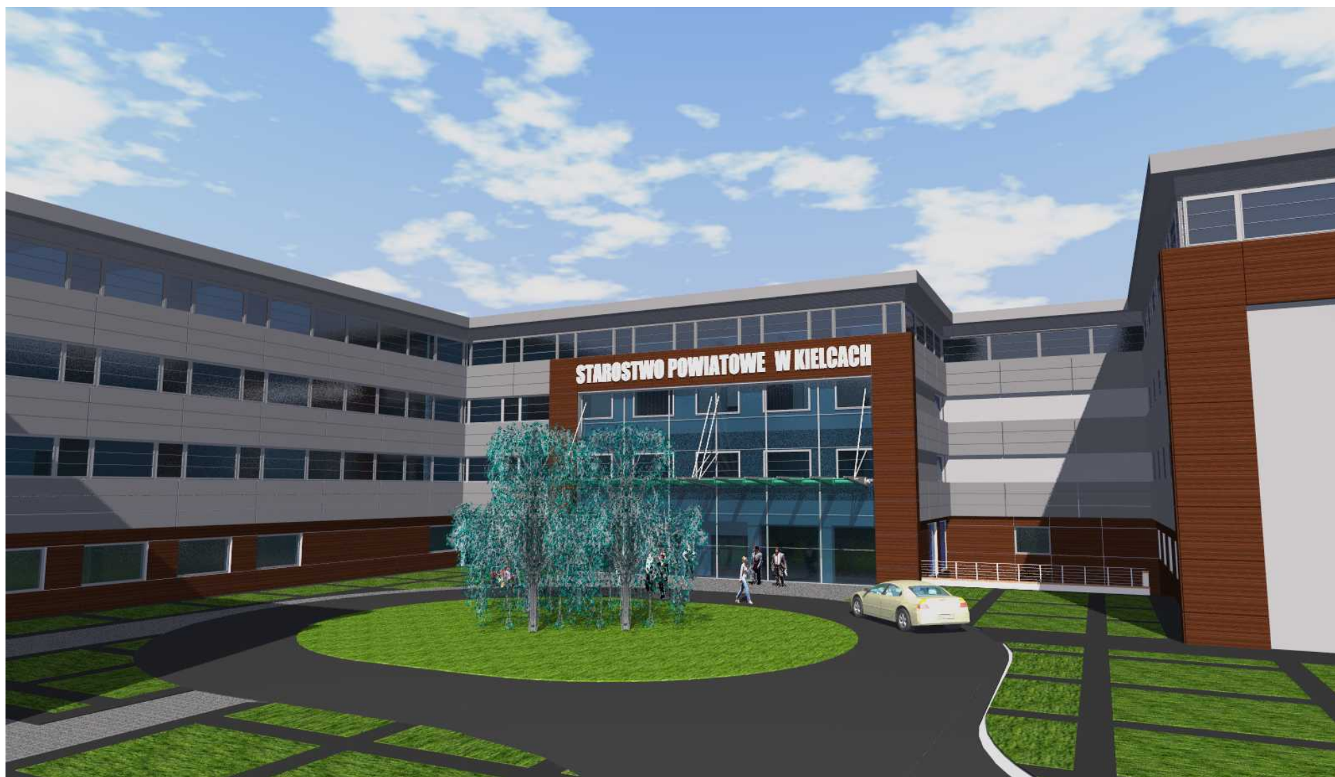
03. Widok od strony południowej - dziedziniec